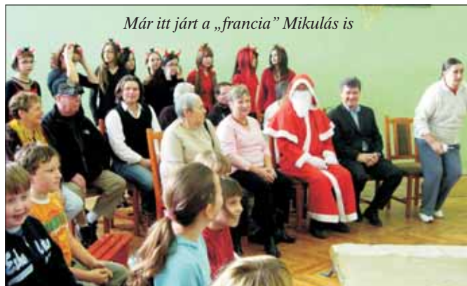
Már itt járt a „francia” Mikulás is

Összefoglalva sűrű volt a november, s gondolom diák és pedagógus egyaránt várja már a téli szünetet.