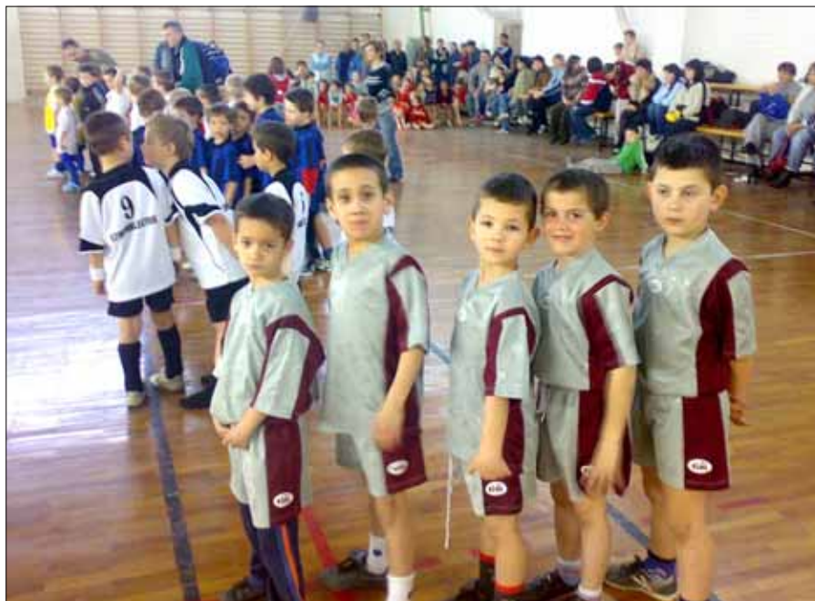
Baracsi Ovifoci Kupa 2008. — 1. helyezett: Perkátai csapata